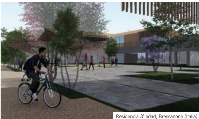
Residencia 3ª edad, Bressanone (Italia)