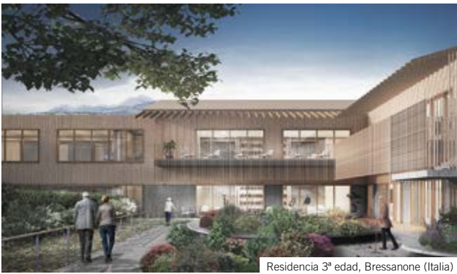
Residencia 3ª edad, Bressanone (Italia)