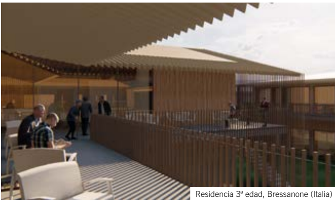
Residencia 3ª edad, Bressanone (Italia)