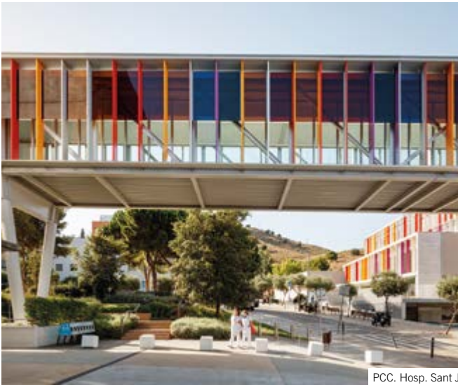
PCC. Hosp. Sant Joan de Déu (Barcelona)