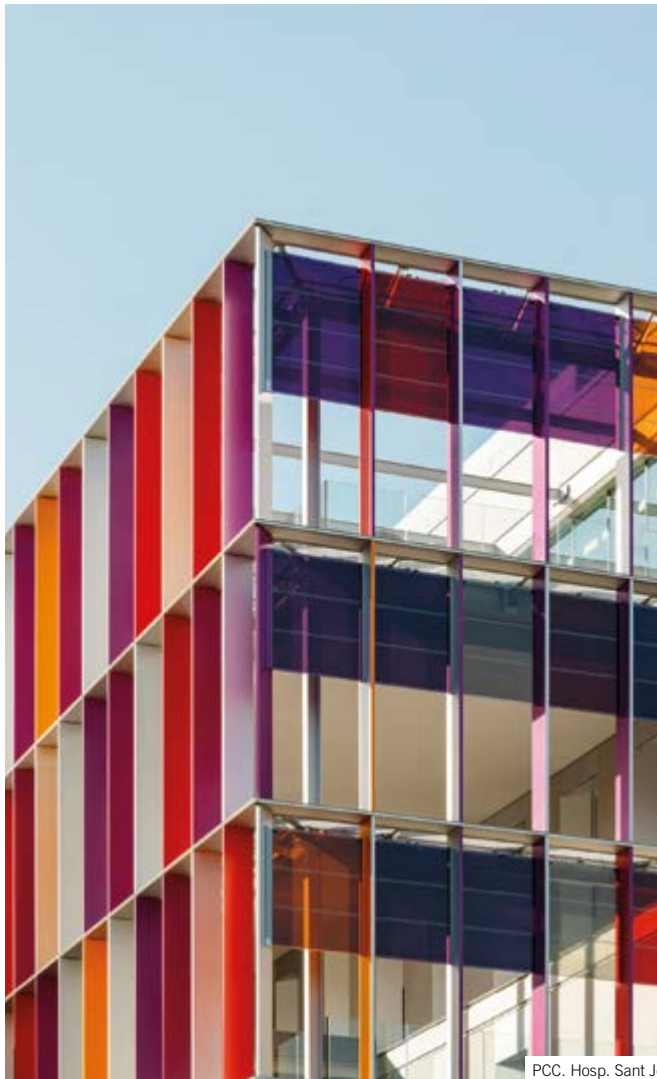
PCC. Hosp. Sant Joan de Déu (Barcelona)