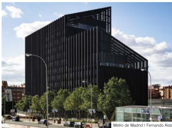
Metro de Madrid / Fernando Alda

| 2011: 25 viviendas sociales Innerstädtische Wohnquartiere, Selb (Alemania) | 2010: Centro Polivalente Valle de Salazar, Iciz (Navarra) | 2008: European 09 en Selb (Alemania); Arquitectura y Urbanismo. | ■ Segundo Premio | 2020: Bosque Metropolitano de Madrid (con BUUR) | 2019: Ordenación urbana y Nuevo Colegio en Kemnath (Alemania), (junto con ALN) | Museo del Baluarte de la Bandera, Rehabilitación, Ceuta | 2017: Plaza de la Remonta, Espacio Público, Madrid | 2015: IVM Passages Shanghai, Expo 2010 (China) | 2011: European 11 en Linz (Austria); Arquitectura y Urbanismo | 2010: European 10 en Forchheim (Alemania); Arquitectura y Urbanismo | 2008: European 09 en AMA (Asturias); Arquitectura y Urbanismo. | ■ Tercer Premio | 2021: Nuevo Colegio de Primaria en Bad Mergentheim (Alemania), (con M. Luque) | 2020: Centro de día y Residencia para mayores –Reto Demográfico– en San Esteban del Valle (Ávila) | ■ Menciones de honor | 2022: Edificio aulario-departamental y pista deportiva en el Campus de Vicálvaro de la URJC | 2021: Rehabilitación del Palacio de Malpica en Toledo | Nuevo Museo y Centro de visitantes en el Geoparque de la Unesco Muskauer Faltenbogen en Bad Muskau (Alemania), (con M. Luque) | Rehabilitación del cuartel del duque de Crillon para una residencia en Menorca | 2019: Residencia de mayores en Son Dureta (Palma de Mallorca).