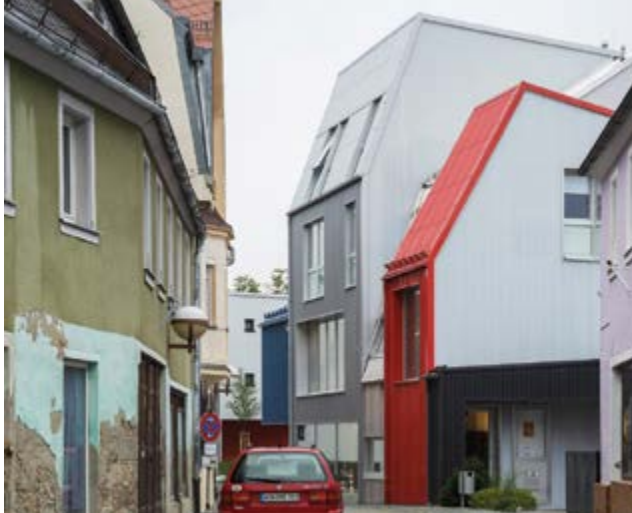
Albergue Juvenil y Casa de la Juventud, Selb (Alemania)

y del libro “Ateneo de Madrid 2016–2022. Rehabilitación y restauración del Ateneo Científico, Literario y Artístico de Madrid”, que documenta el proyecto de las obras.