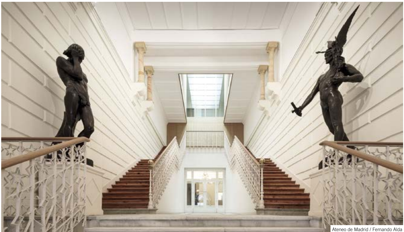
Ateneo de Madrid / Fernando Alda