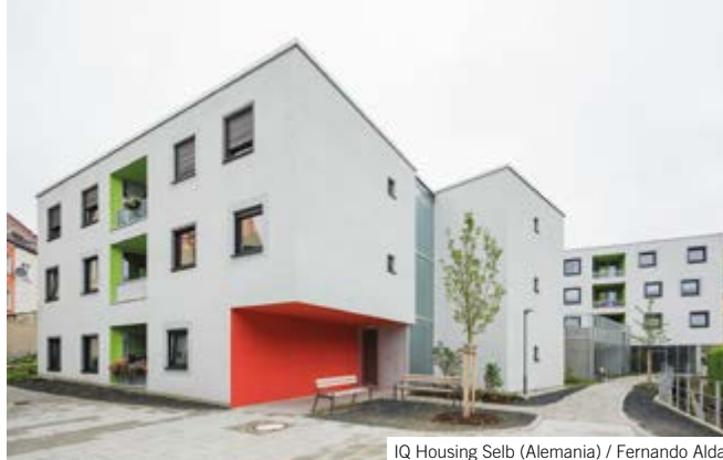
IQ Housing Selb (Alemania) / Fernando Alda

• Premios internacionales a la obra construida / y a la oficina: | 2016: Seleccionada XIII Bienal Española de Arquitectura y Urbanismo. Masterplan de Regeneración Urbana del centro de Selb (Alemania) | 2014: Seleccionados Premios Arquia-Próxima 2014. Centro de Día para Niños, Selb (Alemania) | Seleccionados Premios FAD 2014 Internacionales. Centro de Día para Niños, Selb (Alemania) | Architektouren der Bayerischen Architektenkammer 2014. Centro Día para Niños Selb (Madrid) | 2013: Premio Luis M. Mansilla COAM. Centro de Día para Niños, Selb (Alemania) | Finalista XII Bienal Española de Arquitectura y Urbanismo. Centro de Día para Niños en Selb (Alemania) | 2012: Premio Bauwelt 2013 “First Works”. Centro de día para niños, Selb (Alemania) | Nominación para el Deutsches Architektur Jahrbuch 2013/14. Centro de Día para Niños en Selb (Alemania) | • Premios en concursos nacionales e internacionales: ■ Primer Premio | 2022: Viviendas sociales y paisajismo. Azur (Berchem-Sainte-Agathe), Bruselas (Bélgica), (con Maker) | Centro de Innovación de Tecnología Verde en Mannheim (Alemania), (con UTA) | 2021: IBA 2027 Stuttgart, Complejo de usos mixtos y torre de viviendas en Postareal Böblingen (Alemania), (con UTA) | 2020: Regeneración urbana y viviendas en Marollen, Bruselas (Bélgica), (con Maker) | 2016: Sede de Metro en Madrid, (con Nexo Arquitectura y Andrés Perea) | 2013: Ordenación de plaza pública y frontón en Morentin (Navarra)