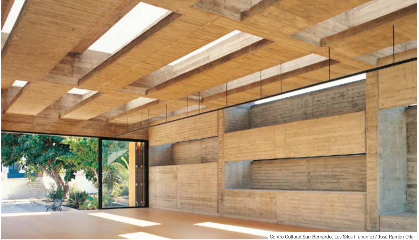
Centro Cultural San Bernardo, Los Silos (Tenerife) / José Ramón Oller