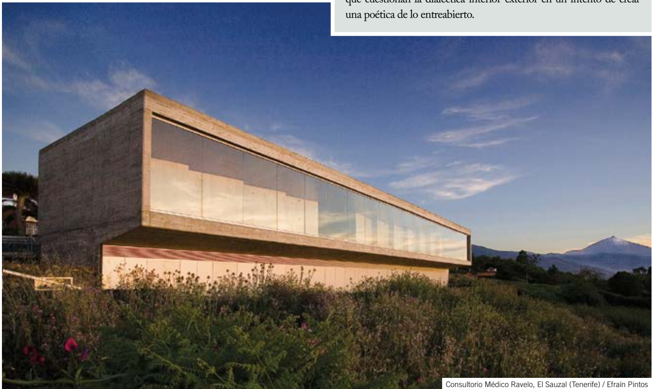
Consultorio Médico Ravelo, El Sauzal (Tenerife) / Efrain Pintos

Nuestro reto como arquitectos, en un espacio insular, es encontrar nuevos modelos habitativos sostenibles, reconduciendo el crecimiento ex novo, para poner en valor el paisaje limitado y frágil de Canarias. La condición insular influye en muchos aspectos, como es la selección de materiales. En un contexto de escasez de materiales locales disponibles, en el que casi la totalidad de los materiales de construcción son importados, existe una posible puesta en valor de materiales como el adobe e incluso el hormigón que aprovecha el uso de cenizas puzolánicas y otros agregados volcánicos locales. Debido al clima moderado de Canarias, nuestros proyectos podrían concebirse como espacios que cuestionan la dialéctica interior-exterior en un intento de crear una poética de lo entreabierto.