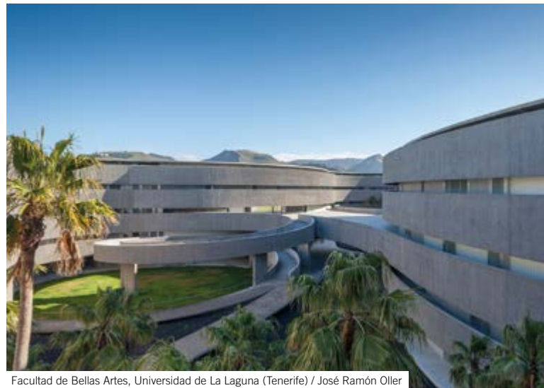
Facultad de Bellas Artes, Universidad de La Laguna (Tenerife) / José Ramón Oller