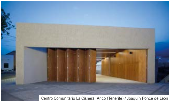
Centro Comunitario La Cisnera, Arico (Tenerife) / Joaquín Ponce de León