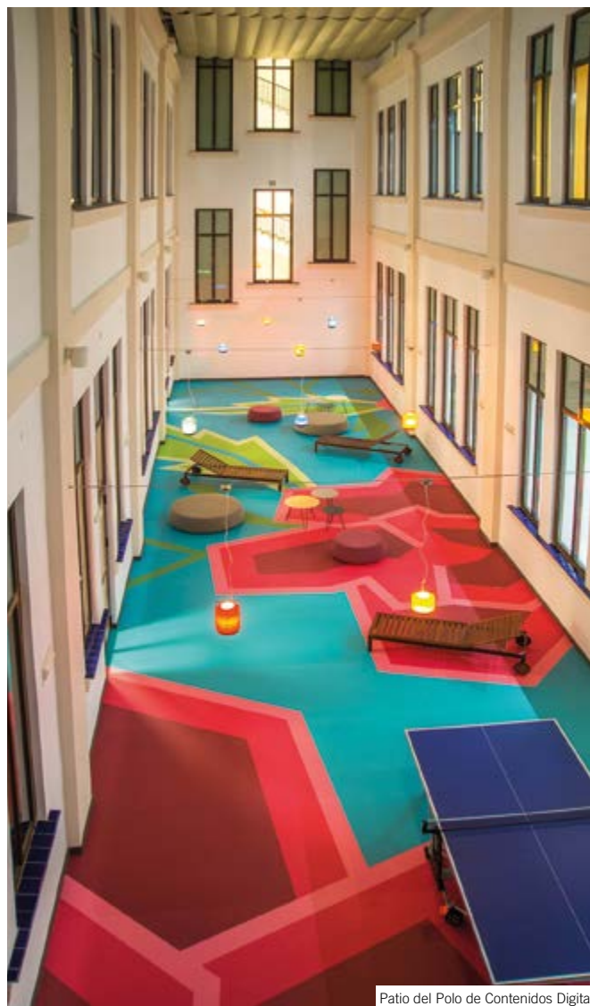
Patio del Polo de Contenidos Digitales de Málaga (2015)