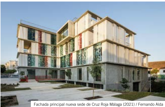
Fachada principal nueva sede de Cruz Roja Málaga (2021) / Fernando Alda