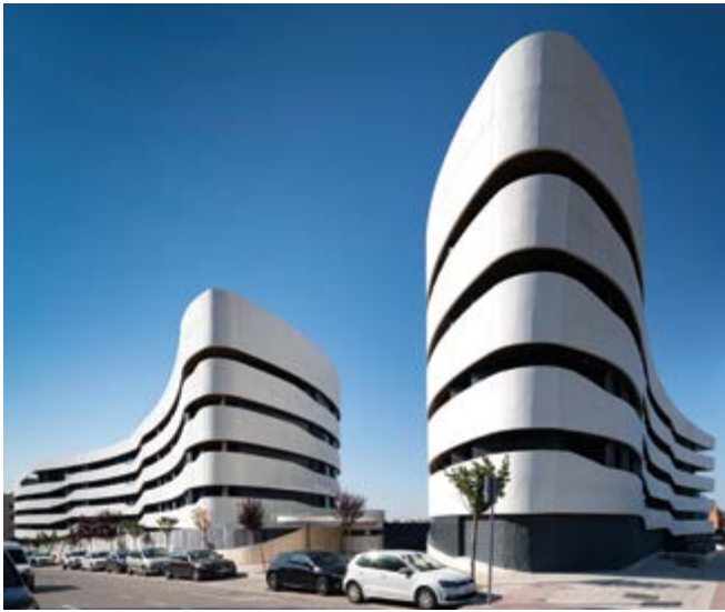
Allea Homes San Sebastián de los Reyes / Promotor: Neinor Homes