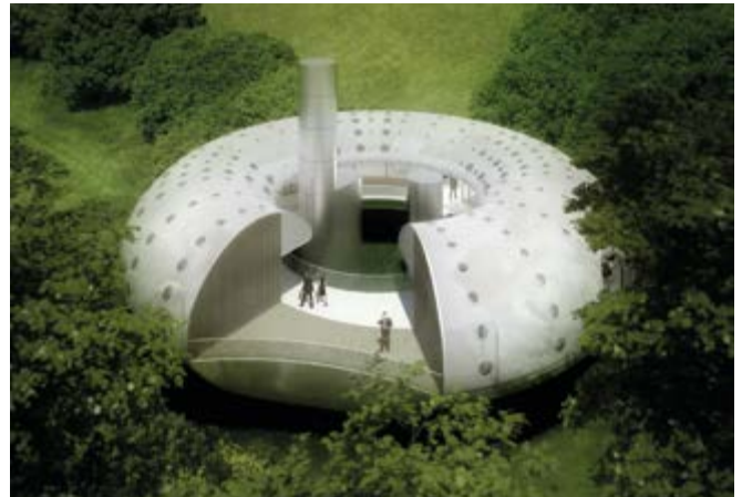
Prototipo de entorno tecnológico Open Office / Infografistas: Promt Collective / Promotor: Pablo Boyer y Cano y Escario Arquitectura