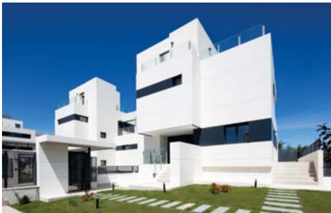
Unifamiliares Célere Grace Valdemarín, Madrid / Foto: Álvaro Viera / Promotor: Vía Célere