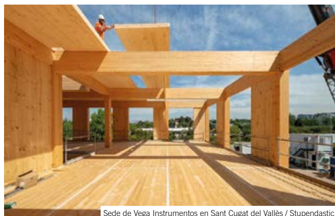
Sede de Vega Instrumentos en Sant Cugat del Vallès