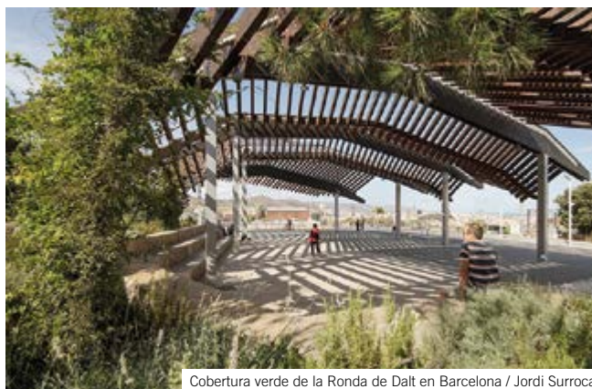
Cobertura verde de la Ronda de Dalt en Barcelona / Jordi Surroca