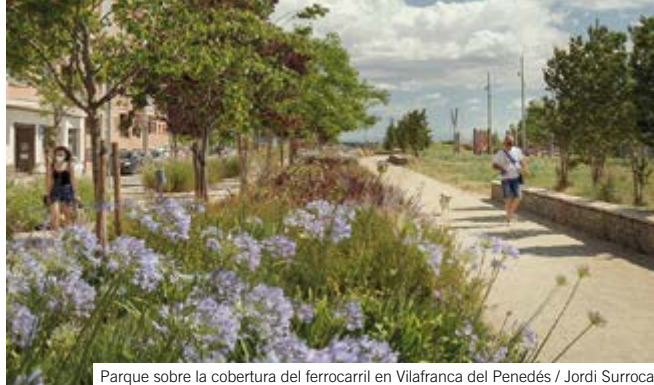
Parque sobre la cobertura del ferrocarril en Vilafranca del Penedés / Jordi Surroca

• Paisajismo: Urbanización de la cobertura de la Ronda de Dalt en Barcelona | Paisajismo del MEETT Toulouse Exhibition and Convention Centre | Renaturalización de dos autopistas en Riyadh (Arabia Saudí) | Restauración de las antiguas minas de yeso de Igualada (Barcelona) | Restauración paisajística del vertedero del Garraf (Barcelona) | Restauración medioambiental del río Llobregat | Cementerio Metropolitano De Roques Blanques (Barcelona) | • Administrativo/Oficinas: Nueva sede