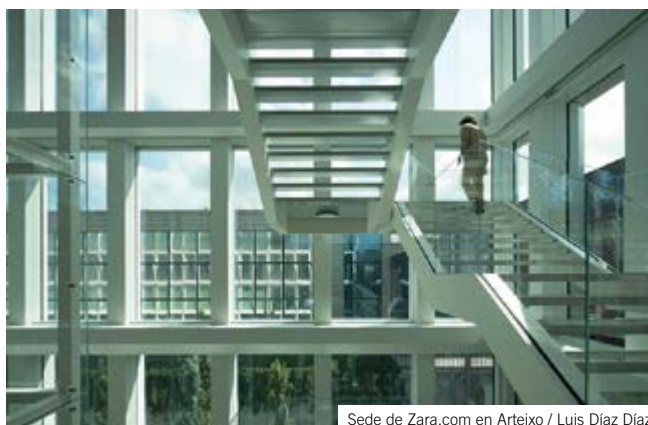
Sede de Zara.com en Arteixo