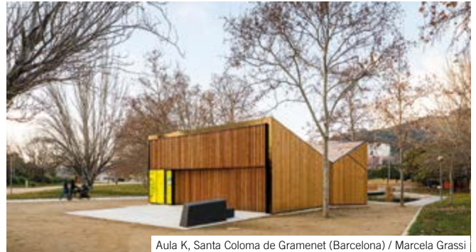
Aula K, Santa Coloma de Gramenet (Barcelona) / Marcela Grassi