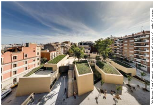
Biblioteca Sant Gervasi-Joan Maragall (Barcelona) / Ariel Ramírez

BCQ arquitectura barcelona trabaja para hacer las ciudades más humanas, sostenibles y eficientes, creando proyectos arquitectónicos y urbanos que combinan sensibilidad e inteligencia con criterios bioclimáticos y medioambientales. El objetivo final de la creación de proyectos es hacerlos reales. Por esta razón, BCQ considera de suma importancia la calidad de sus técnicas de construcción, materiales y edificios, así como cumplir con un sistema de gestión de calidad, sostenibilidad y ecodiseño.