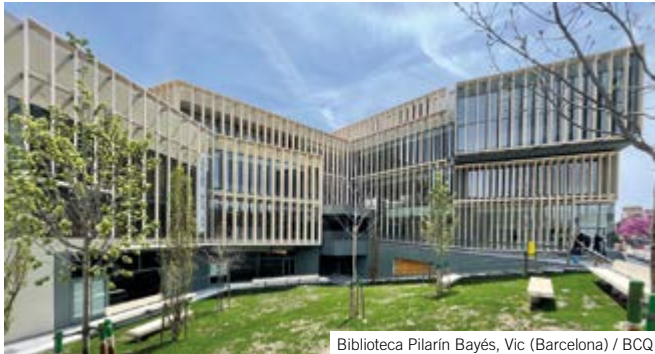
Biblioteca Pilarín Bayés, Vic (Barcelona) / BCQ