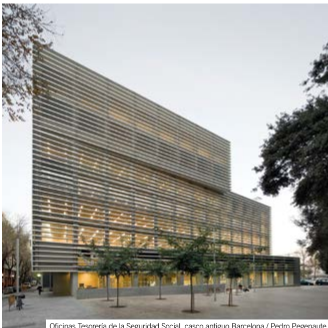
Oficinas Tesorería de la Seguridad Social, casco antiguo Barcelona

| 2017: Mención especial Concurso Reurbanización Plaza Sòller y ampliación equipamiento | 2015: Premio Ciutat de Barcelona, Biblioteca Joan Maragall | Premio Catalunya Construcció, Biblioteca Joan Maragall | Mención jurado Premios Beyond Building Barcelona Construmat, Biblioteca Joan Maragall | 2013: Premio MIPIM (Cannes), Depuradora Alt Maresme Nord | Mención especial Premio Catalunya Construcció, Oficinas Seguridad Social en Ciutat Vella | 2012: Accésit Concurso restringido Residencia Pedagógico-Social, Karlsruhe (Alemania) | 2009: Tercer Premio Concurso Estación Marítima y Ordenación zonas anexas al Cós Nou de Mahón | 2003: Premio Bienal de Arquitectura del Vallès, Edificio Brigadas Municipales, Sta. Perpètua de Mogoda | 2002: Premio AJAC, Piscina cubierta tipo para municipios (La Coruña).