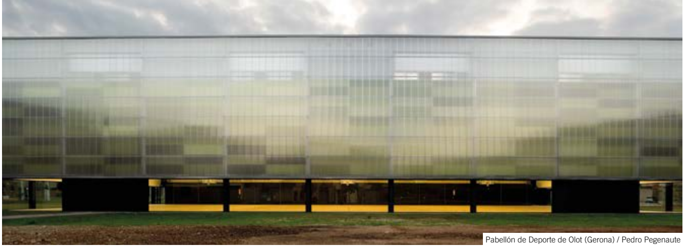
Pabellón de Deporte de Olot (Gerona)