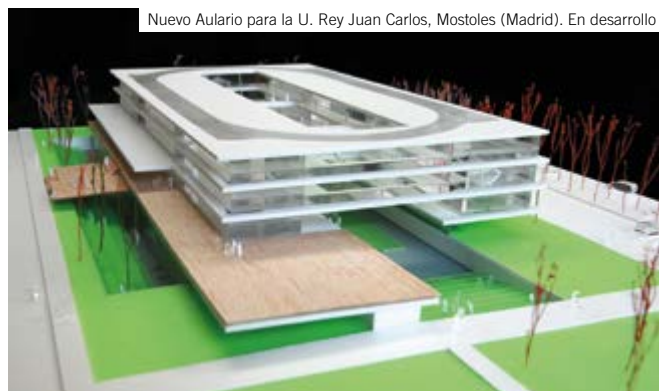
Nuevo Aulario para la U. Rey Juan Carlos, Mostoles (Madrid). En desarrollo