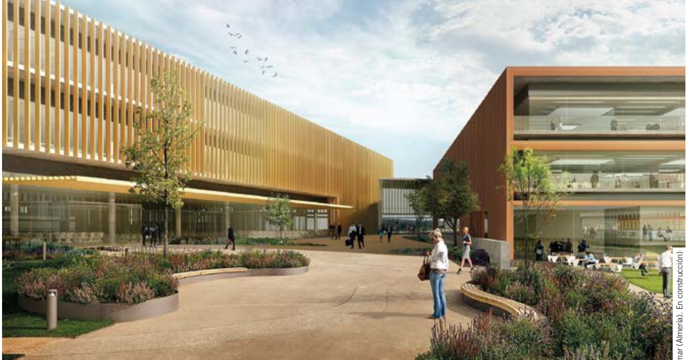
Centro Financiero BCC - Grupo Cajamar (Almería). En construcción