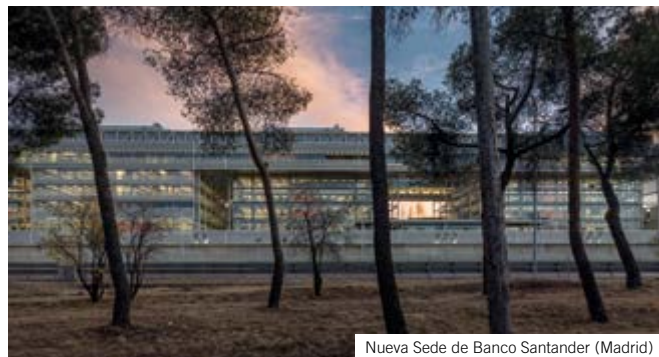
Nueva Sede de Banco Santander (Madrid)