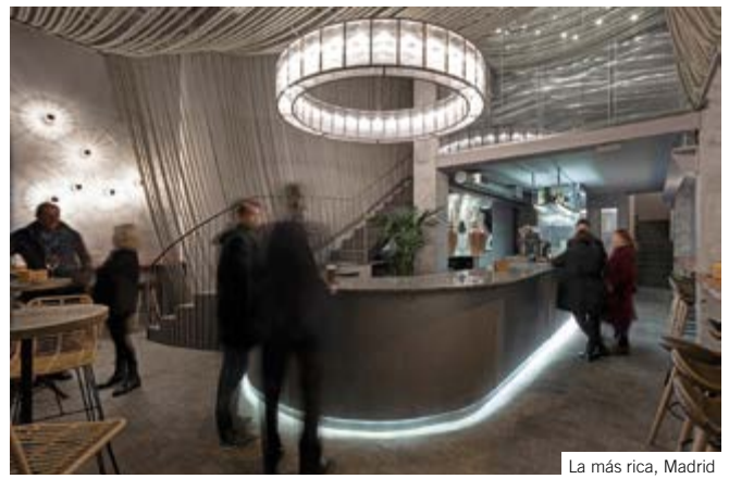
La más rica, Madrid